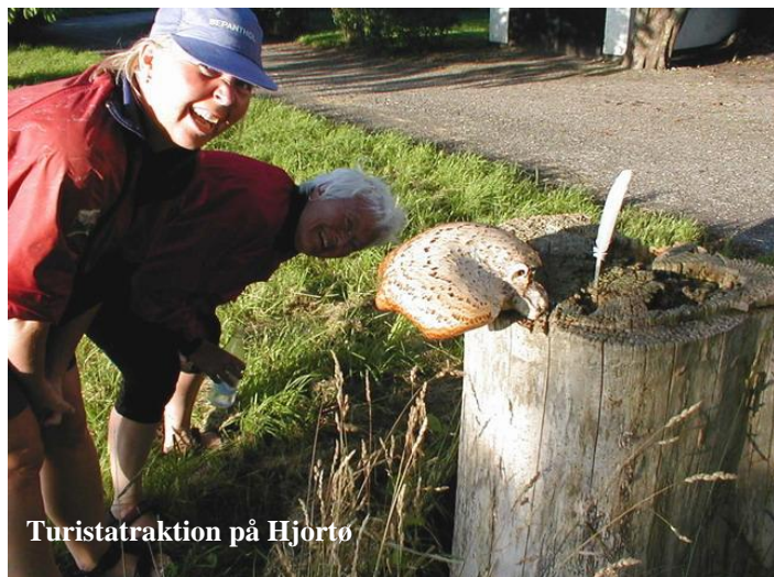
Turistattraktion på Hjortø