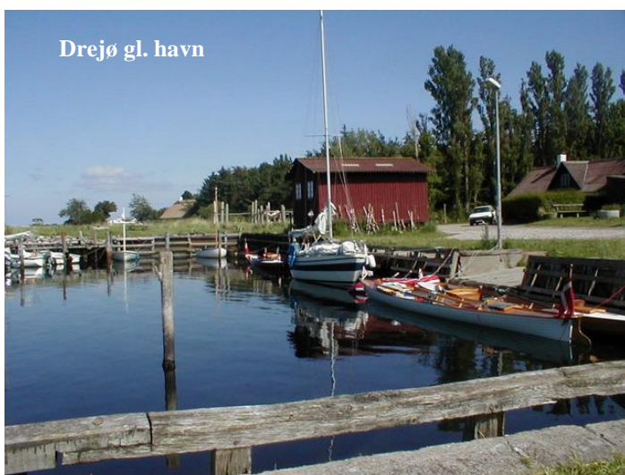
Drejø gl. havn