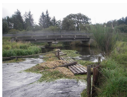
Spærringen ved Resen