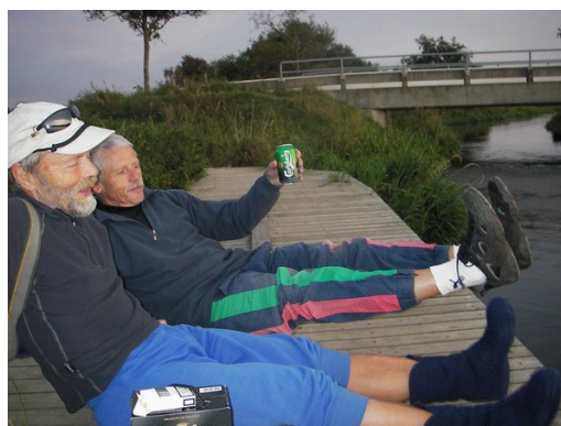
Væske, afslappende øvelse og udstrækning