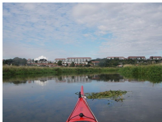
Indsejlingen til Skive

Det sidste stykke gennem byen spændende - et helt Venedig, men det sidste stykke ud af byen til fjorden var lidt træls, og helt galt blev det i åudløbet, hvor der ingen vand var, og hele tiden frygtede at skulle ud og gå.